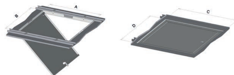
Trappe d'accès au groupe